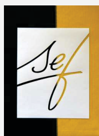
Uklonite foliju, gotovo!

Čuvati na hladnom i suvom mjestu, zaštićenom od uticaja svjetla. Savjetujemo vam da ne prekoračite predviđeni period upotrebe od 36 mjeseci. Tehničke specifikacije oslanjaju se na brojne testove i tehničke resurse. Zbog raznih mogućih uticaja tokom refiniranosti i upotrebe, specifikacije treba posmatrati kao referentne vrijednosti. Preporučujemo prikladni test na originalnom materijalu. Pravno obvezujuća garancija specifičnih karakteristika ne može biti izvedena iz naših specifikacija.