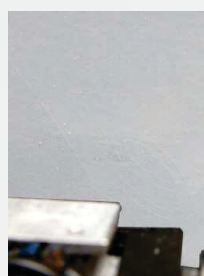
Rezanje kao u ogledalu

FlexCut Sticky SubliBlock II je vodootporan na 60 °C.